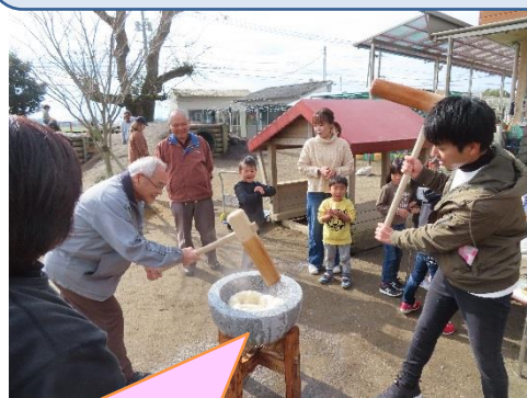
お父さんと息のあったかけ合いで最高のお餅が出来、しょうゆとりのりで食べました。

初めての谷頭こども園での冒険遊びに大人56名子ども46名の参加がありました。親子で大工遊び、昔遊びに挑戦したり、味噌汁作り、餅つき、パン作り、スルメやべっこう飴作りなど、たき火を囲んで体験したりしました。餅つき、昔遊びでは、チーム横市の方々も参加し、一緒に協力し楽しんで下さいました。