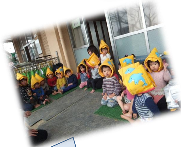
地震訓練 揺れがおさまったので防災頭巾で頭を守る話を聞きました。