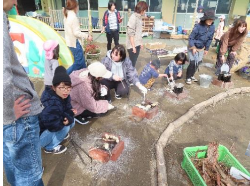
メザシ、スルメ、餅、マシュマロ、を炭で焼いて食べたよ。