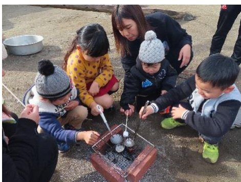
べっこう飴は、根気よくお玉持って飴色になるまでがまん！あまーい飴になるよ。