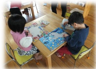
52ピースも出来るようになったよ。