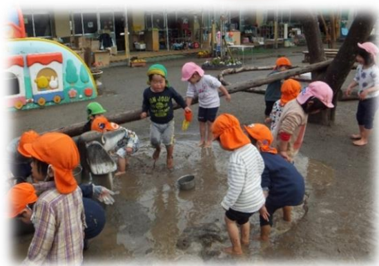
雨上がり、最高の水たまりで泥んこ！！気持ちいいね。以上児はスライダーごっこでスリルを味わっていました。