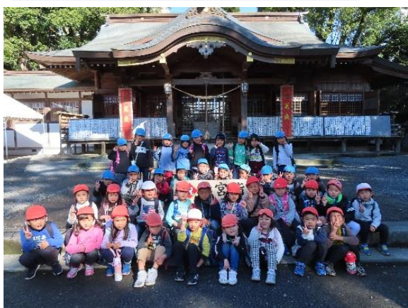
電車に乗って4、5歳児で神柱神社へ初詣公園で存分に遊んでお弁当を食べました。