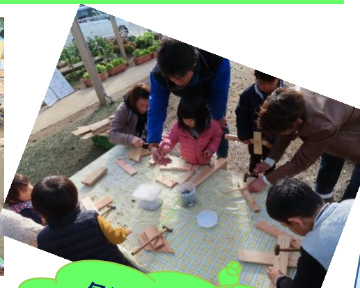
何が出来るかなあお父さん完成が楽しみだね