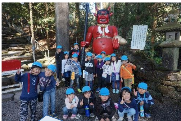
谷頭、おおむた、縄瀬3園合同で東霧島神社へ初詣。赤鬼に出迎えられ、石の階段を登ってお参りました。