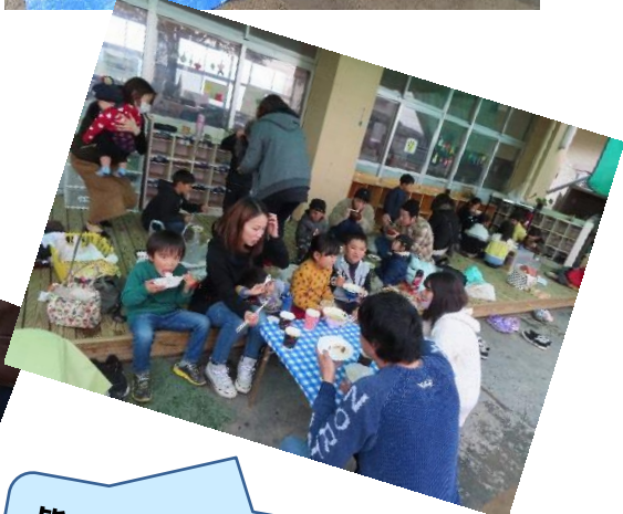
皆で食べる温かい味噌汁と釜で炊いたご飯は最高のご馳走でした。