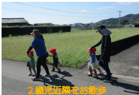
2歳児近隣をお散歩

2歳児も職員と一緒に手を繋ぎ、散歩を楽しんでいます。自然の中でいろいろな発見をし、刺激を受けています。