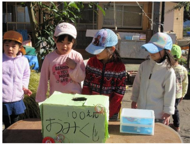
おみくしコーナーもあり、盛り上がっていました！