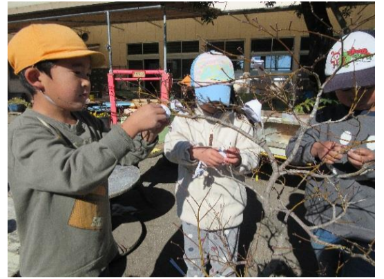
榎木に挿す作業は難しい！

保育園に神社ができました。「なわぜ神社」子どもたちはお賽銭を入れ、鈴を鳴らし「みんなが元気で過ごせますように」とお祈り！！