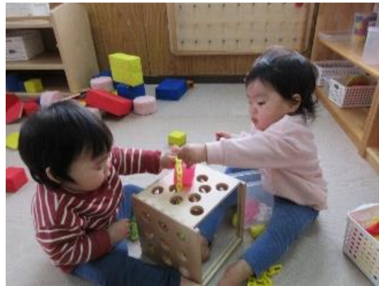
0.1 歳児の室内あそびの様子！遊びの基本「出したり、入れたり」「積んでみたり」集中して遊んでいます。