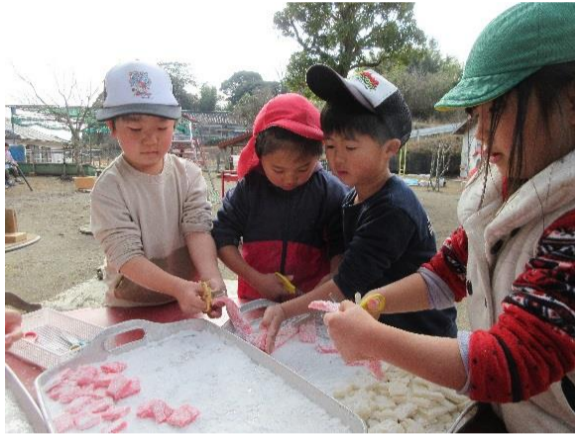
赤、黄、白、緑、色とりどりのつきたての餅を小さく切ります。「つきたては、温かいね」などの会話が聞かれ、餅の柔らかい感触を味わいながら良い経験になりました。