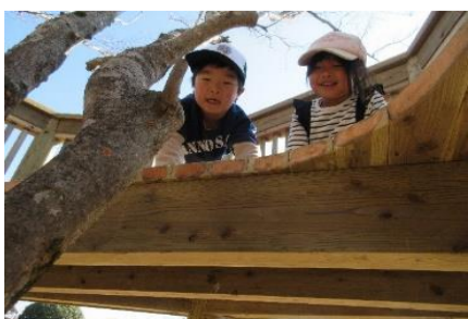
繰り返し、挑戦して登れるようになった子ども達の顔は笑顔にあふれています。年長組8名はみんなで上から景色を見よう！と日々励まし合っています。