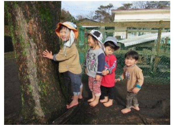
寒い日でも裸足になって遊ぶ子ども達。裸足になることで、土踏まずの形成に繋がります。