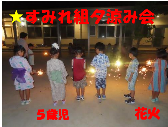
★すみれ組夕涼み会

夕涼み会の出し物や献立を話し合いました。大人が間に入り、自分の気持ちを伝えたり、相手の気持ちを知ったりしながら、1つのテーマに沿った話し合いをします。