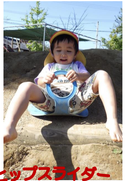
ヒップスライダー