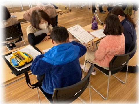
子どもたちを優しくサポート

乙房小学校、菓子野小学校3~4年生を対象として学習支援「庄内わくわくスクール」を開講しました。12月26日、1月5日に実施され総勢20名の参加者が集まりました。冬休みの宿題を1時間。分からないところはサポーターの方に教えてもらいながら冬休みの宿題を進めていきました。その後NPO法人ひむかおひさまネットワークの方に地球温暖化、エネルギーの講話をしていただき、ソーラーカーを作成しました。講話ではクイズに楽しく参加、ソーラーカーづくりでは細かい作業に苦戦しながらもなんとか全員が完成させ走らせていました。