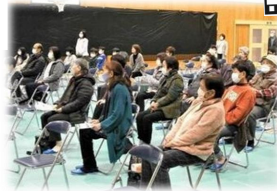
3年ぶりの開催西岳映画祭

11月26日(土)に「にしだけ福祉映画会」を実施しました。地域住民の集いの場作りと、福祉に対する思いの共有を目的として開催している本映画会。3年ぶりの開催となった今回は、第二次世界大戦下の広島を描いた映画『この世界の片隅に』を上映し、延べ98名の方々にご来場いただきました。上映後のアンケートでは、「西岳で映画を観れる事は、あまりない機会なので良かった」「心に沁みだ」「実際に広島で被爆した祖父を思いながら涙した」などの声をいただきました。今後も映画等を通して地域全体で繋がりが持てる場づくりが出来ればと考えています。