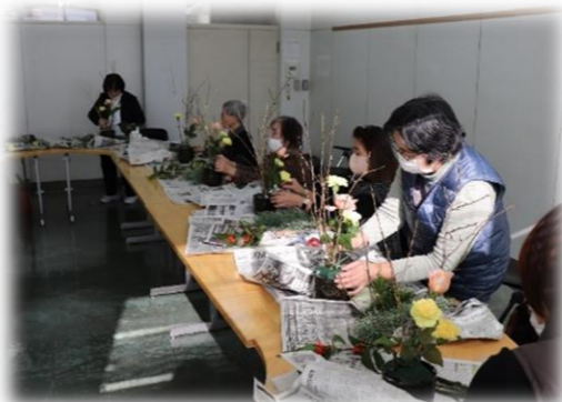
おしゃべりしながらフラワーアレンジメント