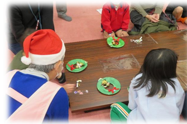
みんなで楽しいクリスマスパーティー