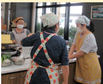
～調理実習～-まちなかキッチン-