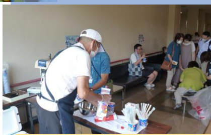
援助会員さんも今日は氷と奮闘中！！